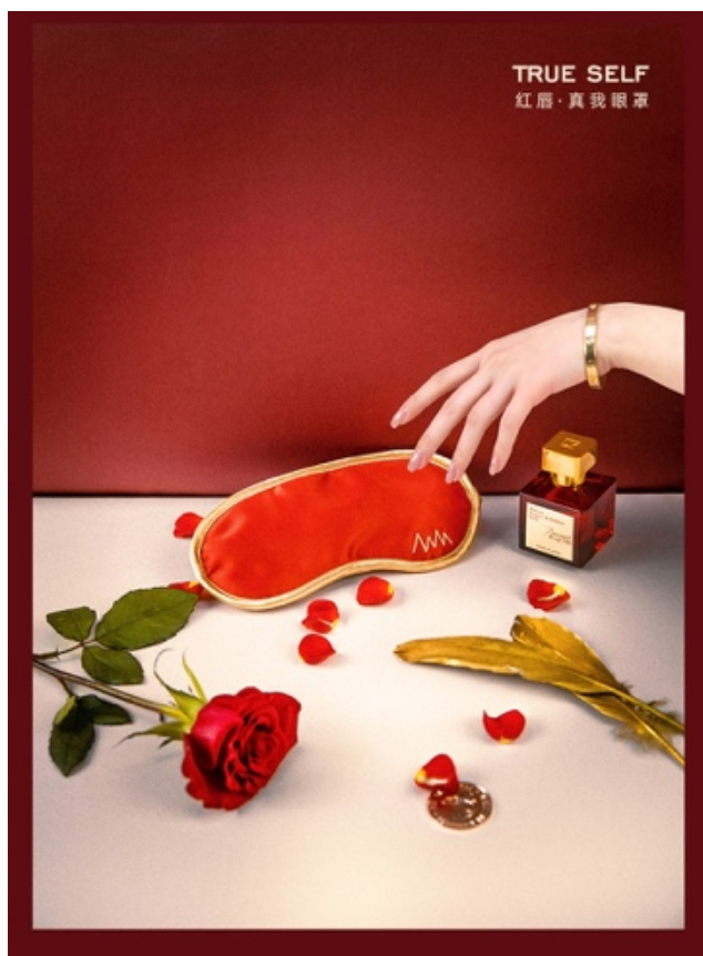
明星挚爱单品，Copper Active活性铜离子眼罩

此次联名礼盒中搭配了iluminage易美肌Copper Active活性铜离子眼罩与枕套。其中Copper Active活性铜离子眼罩一直备受明星热爱的，胡歌，宋佳、古力娜扎、杨烁、于小戈等明星都曾随身携带。