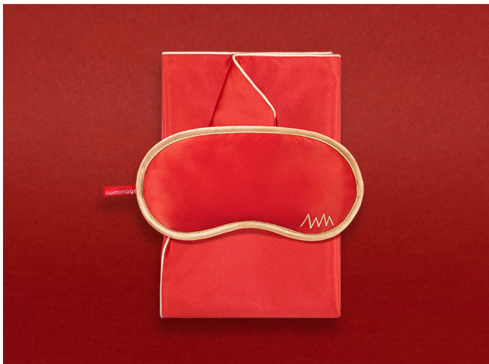
Copper active 活性铜离子“黑科技”织物

此次合作款织物，面料采用的是新一代抗菌黑科技——Copper Active活性铜离子，是利用了“铜”离子的生物活性共混纺织，创新而成的智慧科技面料，具备抗菌防螨、改善肤质、淡化细纹等“黑科技”效果。作为iluminage易美肌的新晋产品系列，Copper Active活性铜离子系列，已推出眼罩、枕套、口罩等多款产品。